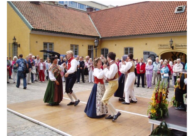
Folkdans på Kronhusgården.