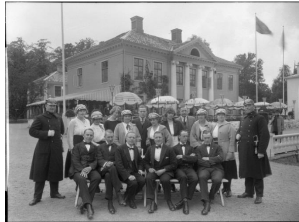
Serveringspersonal framför Wårdshuset på Liseberg. Jubileumsutställningen 1923.