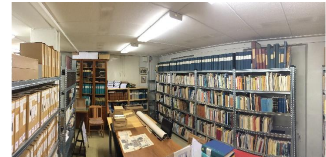
Del av Forskningsarkivet.

Göteborgs Hembygdsförbund har sina lokaler i ett hus som uppfördes 1748 för Fortifikationen på Postgatan 4 i Kronhuskvarteret.