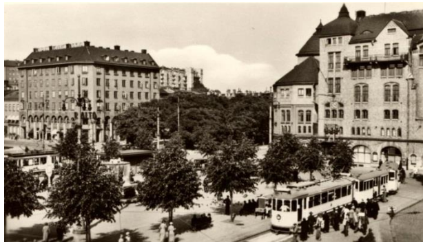
Järntorget på 1940-talet.

Man finner sin identitet. Man är en del av det som varit och det som är. Samtidigt är man en brygga mot framtiden.